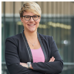
Karin Zimmermann Kommunikation Communication