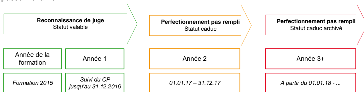
Graph. 1 Vue d'ensemble de l'obligation de perfectionnement avec exemple

Le juge qui laisser également passer ce délai verra son statut passer à caduc archivé au début de la troisième année. Pour que son statut redevienne valable , il devra suivre la formation de base et repasser l'examen.