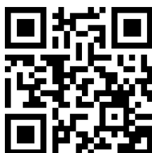
Atelier du futur club sportif